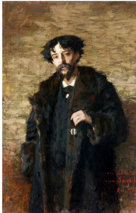
Portrait d'Alphonse Daudet par Luigi Rossi, Paris 1887