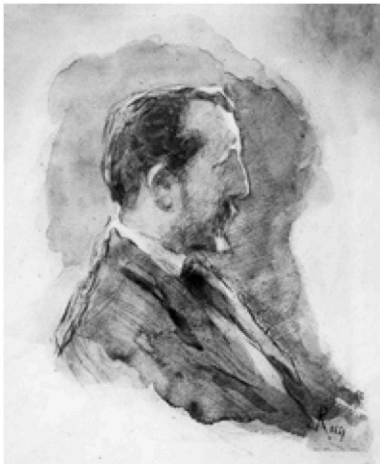
Luigi Rossi Autoportrait Milano 1900